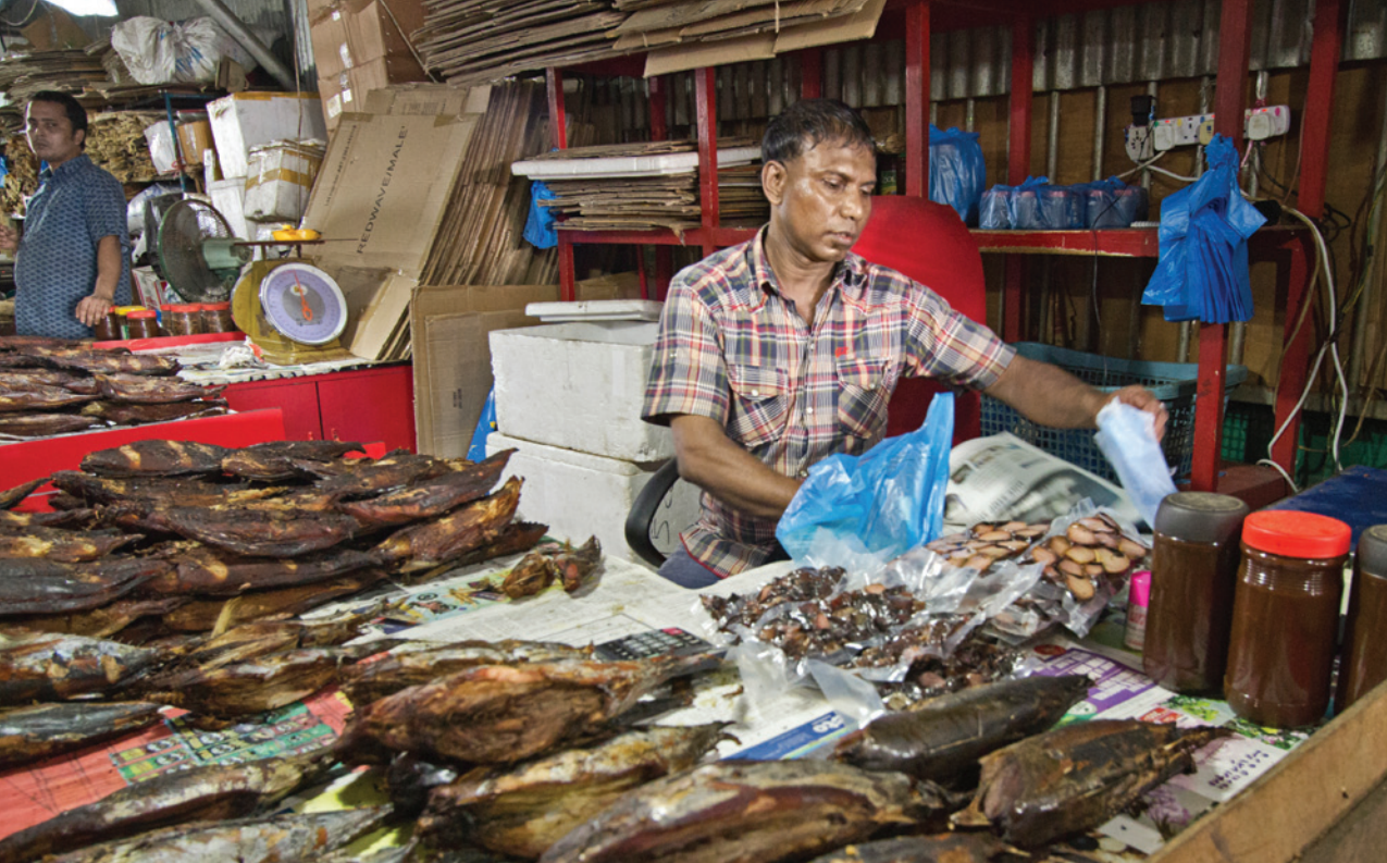
PRODAVAČ NA VALHO MAS MARKET ANEB NA TRHU SE SUŠENÝMI RYBAMI V HLAVNÍM MĚSTĚ MALE NA SEVERNÍM MALE ATOLU

jsou resorty, při čemž v provozu je jenom jeden, a to starší a cenově dostupný resort Filitheyo s pěkným korálovým útesem. Ostatní ostrovy jsou neobydlené. Fafu atol je turisticky méně známý. Z obydlých ostrovů není pro návštěvu zajímavý žádný, nicméně obyčejné penziony se tu najít dají. Čas od času se tu vyskytuje i žralok obrovský (whale shark) a sezónně také manty.