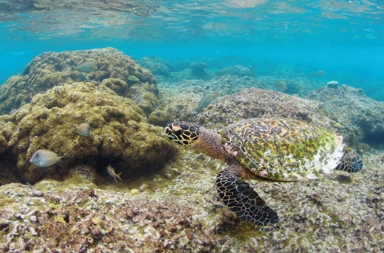
KORÁLOVÉ BLOKY A ŽELVA (HAWKSBILL TURTLE) U OBYDLENÉHO OSTROVA THODDOO NA ALIF ALIF ATOLU NA MALEDIVÁCH

nejdostupnějších resortů Sun Island a Holiday Island s nádhernými plážemi a lagunou.